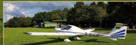
* D-EUCH | Katana DV20, Kategorie VLA. Die Ausbildung dafür (Klassenberechtigung SEP) kann im LSCN erfolgen